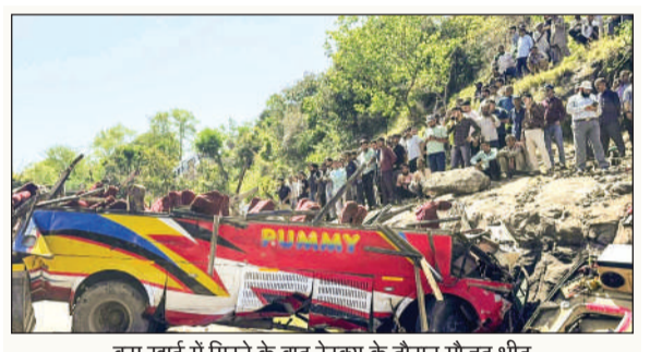
बस खाई में गिरने के बाद रेस्क्यू के दौरान मौजूद भीड़

दक्षिण कोरिया के राष्ट्रपति ली जे-युंग ने सोमवार को कहा कि होर्मुज स्ट्रेट से सुरक्षित नौवहन सुनिश्चित करने के लिए भारत और दक्षिण कोरिया को मिलकर काम करना चाहिए। उन्होंने ग्लोबल सप्लाइ चैन को स्थिर रखने और उर्जा सुरक्षा मजबूत करने के लिए दोनों देशों के बीच घनिष्ठ सहयोग की आवश्यकता पर जोर दिया। एक विशेष लिखित इंटरव्यू में राष्ट्रपति ली ने कहा कि अमेरिका-ईरान तनाव के कारण होर्मुज स्ट्रेट में किसी भी तरह की रुकावट से वैश्विक तेल कीमतें बढ़ रही हैं और जरूरी औद्योगिक सामग्री की सप्लाइ चैन बाधित हो रही है। राष्ट्रपति ली ने कहा कि कोरिया गणराज्य और भारत दोनों ▶ शोष पेज 6 पर ▶ पढ़ें पेज 10 भी