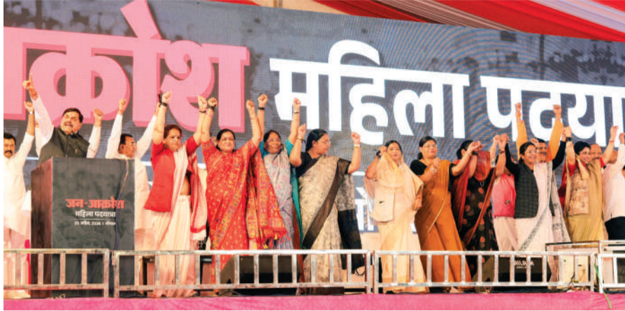
जन आक्रोश महिला पद यात्रा में मुख्यमंत्री डॉ. मोहन के साथ मंत्री, विधायक, सांसद व भाजपा महिला पदाधिकारी।

भोपाल के एमवीएम कॉलेज ग्राउंड से निकली भाजपा की जन आक्रोश महिला पद यात्रा रोशनपुरा चौराहे पर समाप्त हुई। यहां मुख्यमंत्री डॉ. मोहन यादव, प्रदेश भाजपा अध्यक्ष हेमंत खंडेलवाल व अन्य नेताओं ने काले गुब्बारे उड़ाकर रैली का समापन किया। मुख्यमंत्री ने कहा कि बिना माताओं के आशीर्वाद कैसे मिल सकता है? ये भाषण का विषय नहीं, हमारे अंदर के आक्रोश को देश के सामने लाने का समय है। अक्षय तृतीया जैसे त्योहार के बावजूद बहनों आक्रोश व्यक्त करने के लिए बड़ी संख्या में यहां आई हैं। मुख्यमंत्री ने कहा कि हम सभी अपने जिले, नगर पालिका, नगर परिषद में भी विरोध व्यक्त करेंगे।