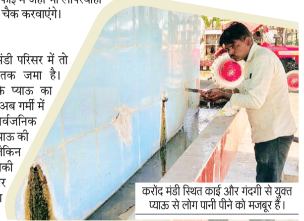
करोंद मंडी स्थित काई और गंदगी से युक्त प्याऊ से लोग पानी पीने को मजबूर हैं।

गर्मी के दिनों में मंडी परिसर में तो गाद और गंदगी तक जमा है। हालांकि अब पक्के प्याऊ का चलन बंद हो गया। अब गर्मी में नगर निगम सार्वजनिक स्थलों पर अस्थाई प्याऊ की व्यवस्था करता है, लेकिन जो पक्के बने हैं, उनकी देखरेख की ओर जनप्रतिनिधियों का ही ध्यान नहीं है।