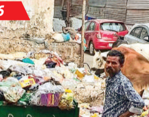
निगम प्रशासन को यह शिकायत मिल रही है कि 50 फीसदी अधिकारी अपने-अपने क्षेत्र में सुबह 6 बजे तक पहुंच रहे हैं। पुराने शहर के करोंद से लगी कॉलोनीयों में सफाई व्यवस्था को लेकर लोग परेशान हैं। जगह-जगह कचरे के ढेर, सीवेज टैंक होने जैसी समस्याएं हैं।

100 से ज्यादा नोडल अधिकारियों को दी गई रोज सुबह 6 से 9 बजे तक व्यवस्था देखने की जिम्मेदारी