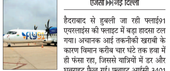
तकनीकी खराबी आने से बड़ा हादसा टला

करीब चार घंटे तक हवा में फंसा विमान हुबली जा रहे विमान की बेंगलुरु में आपात लैंडिंग