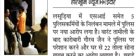
झगड़े की वजह रिटायर्ड एसीपी का प्रॉपर्टी विवाद

लसूड़िया पुलिस पर लूट का भी आरोप पुलिस घर में चोरों की तरह घुसी, 22 तोला सोना गायब