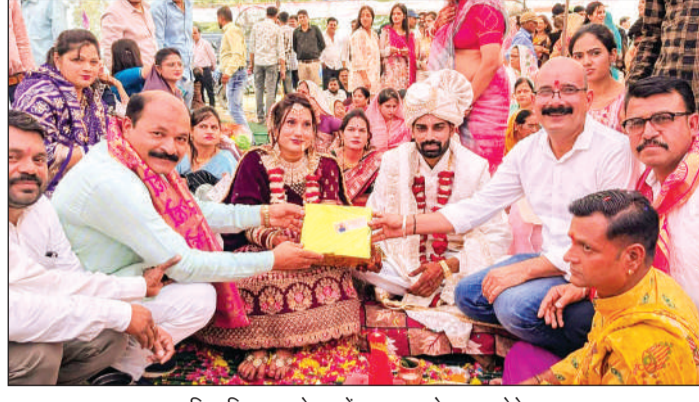
सामूहिक विवाह सम्मेलन में वर-वधु को उपहार देते हुए।

सम्मेलन से सामाजिक एकता और भाईचारे को भी मिलती है मजबूती