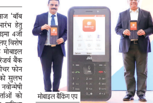
मोबाइल बैंकिंग एप

बैंक ऑफ बड़ौदा एवं रिलायंस जियो ने आज 'बॉब वर्ल्ड लाइट' मोबाइल बैंकिंग एप के शुभारंभ हेतु साझेदारी की घोषणा की। यह जियोफोन ग्राहमा 4जी डिवाइस पर फीचर फोन उपयोगकर्ताओं के लिए विशेष रूप से डिज़ाइन किया गया पहला व्यापक मोबाइल बैंकिंग एप है। भारत सरकार और भारतीय रिजर्व बैंक द्वारा समावेशन को प्रोत्साहित करने और फीचर फोन उपयोगकर्ताओं के लिए डिजिटल भुगतान को सुलभ बनाने के विजन के अनुरूप, यह उद्योग में नवोन्मेषी ब्रान्ड है, जो देशभर में लाखों उपयोगकर्ताओं को बाधारहित एवं व्यापक डिजिटल बैंकिंग सुविधा उपलब्ध कराएगी। यह एप बैंक ऑफ बड़ौदा के मौजूदा ग्राहकों के साथ-साथ किसी भी अन्य बैंक के ग्राहकों के लिए भी सरल और सुविधाजनक स्व-पंजीकरण प्रक्रिया के माध्यम से उपलब्ध होगी। पारंपरिक मोबाइल बैंकिंग ऐप जो केवल स्मार्टफोन पर कार्य करते हैं, जो फोन में 'बॉब वर्ल्ड लाइट' एप को क्लिकवर्थी फीचर फोन पर दैनिक बैंकिंग सेवाओं की व्यापक श्रेणी प्रदान करने के उद्देश्य से विकसित किया गया है जिसके तहत इसका विस्तार अर्ध-शहरी और