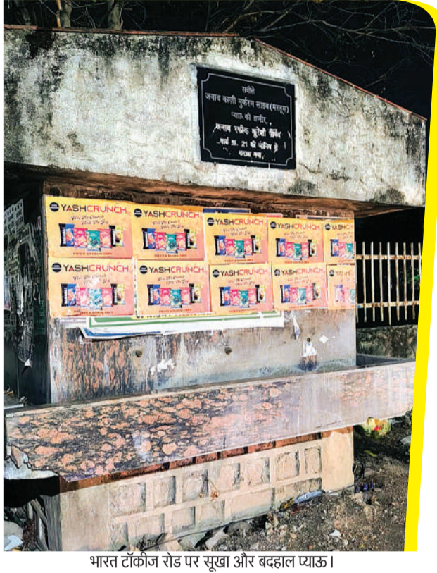
भारत टॉकीज रोड पर सूखा और बदहाल प्याऊ।

बीते दस साल में बने 20 से ज्यादा नए प्याऊ अब हो रहे बदहाल देखरेख और मंटेनेंस की जिम्मेदारी भी स्थानीय जनप्रतिनिधियों की निगम के टैंकरों से भरा जाता है पानी