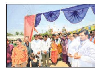
भारत के स्वागत के लिए खड़े लोग।

मंडीदीप में अक्षय तृतीया पर सोमवार को नगर और आस पास के गांव समेत करीब 300 से अधिक शादी हुई, जिसमें नवयुगल जोड़े पवित्र रिश्ते में बंधे और एक दूसरे के साथ रहकर सुख-दुख बांटने की कसमें खाईं। नगर के आस-पास कई जगह सामूहिक विवाह समारोह भी सम्पन्न हुए, जिसमें भोजपुर मंदिर, ग्रामीण पोलाह में लोधा लोधी समाज का सामूहिक 7 जोड़ों