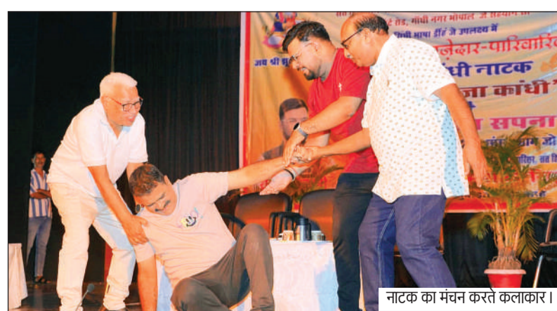
नाटक का मंचन करते कलाकार।