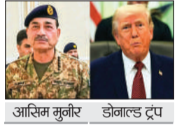
नई दिल्ली

इस्लामाबाद में आज अमेरिका व ईरान के बीच दूसरे दौर की शांति वार्ता होगी। इसके लिए ट्रंप की टीम इस्लामाबाद पहुंच चुकी है। ईरान से कोई नहीं पहुंचा है। दूसरे दौर की बातचीत से पहले होर्मुज को लेकर ईरान अड़ा हुआ है। वह चाहता है कि बातचीत तभी संभव है जब अमेरिका नाकाबंदी खोलेगा। दूसरे दौर की बात मंगलवार को हो रही है और इसी दिन सीजफायर की मियाद खत्म हो रही है। पाक भरसक कोशिश कर रहा है कि होर्मुज मुद्दे पर ट्रंप को समझा लें। पाकिस्तान के सेना प्रमुख आसिम मुनीर ने अमेरिकी राष्ट्रपति डोनाल्ड ट्रंप से इस बारे में बात की है। उन्होंने बताया कि स्ट्रेट ऑफ ▶ शोष पेज 6 पर