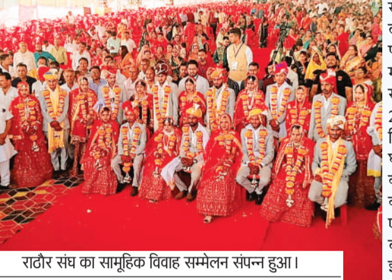
राटौर संघ का सामूहिक विवाह सम्मेलन संपन्न हुआ।

राटौर संघ सामूहिक विवाह एवं परिचय सम्मेलन