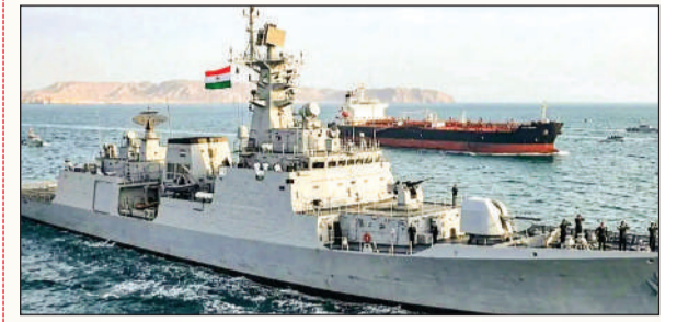
हरिभूमि ब्यूरो नई दिल्ली

देश के जहाजों को दी चेतावनी, लार्क द्वीप से बनाए रखें दूरी, अनुमति के बाद ही आगे बढ़ें