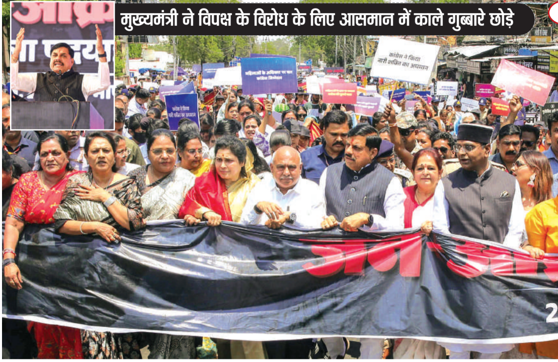
मुख्यमंत्री ने विपक्ष के विरोध के लिए आसमान में काले गुब्बारे छोड़े

नई दिल्ली। अगर आप भी भीम एप के जरिए यूपीआई पेंमेंट करते हैं, तो आपके लिए अच्छी खबर है। डिजिटल ट्रान्जैक्शन को और अधिक सुविधाजनक बनाने की दिशा में नेशनल पेमेंट्स कॉरपोरेशन ऑफ इंडिया (एनपीसीआई) ने एक बड़ा कदम उठाया है। अब भीम यूपीआई एप का इस्तेमाल करने वाले करोड़ों यूजर्स एप के अंदर ही अपना क्रेडिट स्कोर चेक कर सकेंगे। इससे यूजर्स को अपनी फाइनेंशियल हेल्थ ट्रैक करने के लिए अब अलग-अलग प्लेटफॉर्म पर भटकने की जरूरत नहीं होगी। ▶ शोष पेज 6 पर