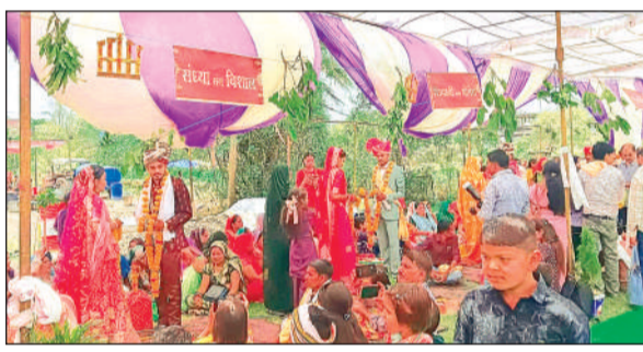
सम्मेलन में वरमाला पहनते वर-वधु।

गार्डन, शादी घर समेत नगर के बड़े होटल फुल, बाजारों में रही मीड़, 2 करोड़ से अधिक की हुई खरीदारी