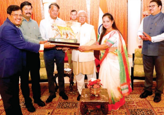
राज्यपाल ने की भारतीय वन सेवा के 2024-26 बैच के प्रशिक्षु अधिकारियों से सौजन्य भेंट।