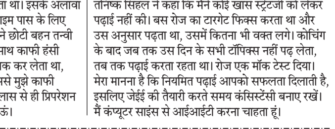
परिजनों संग तनिष्क सिंहल।