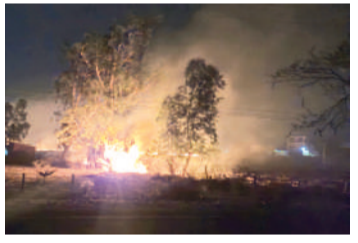
हरिभूमि न्यूज | भोपाल

गेंहूँ की फसल कटने के बाद खेतों में आग लगाने की घटनाएं बढ़ रही हैं। किसानों द्वारा खेतों में नरवाई जलाई जा रही है, जिसकी शिकायतें, वीडियो और फोटो के साथ ढेरों शिकायतें जिला प्रशासन के अफसरों को मिल रही हैं। ऐसे में हुजूर और बैरसिया तहसील में 100 से अधिक खेतों में नरवाई जलाने की जानकारी मिली है, जिसके आधार पर एस्डीएम ने पटवारियों से रिपोर्ट मांगी है, जिसके आधार पर किसानों पर जुर्माना लगाने की तैयारी की जा रही है।