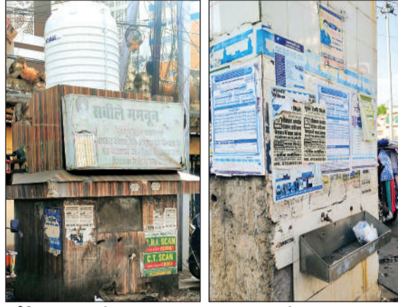
हमीदिया अस्पताल के पास सूखा प्याऊ

बीते दस साल में बने 20 से ज्यादा नए प्याऊ अब हो रहे बदहाल देखरेख और मंटेनेंस की जिम्मेदारी भी स्थानीय जनप्रतिनिधियों की निगम के टैंकरों से भरा जाता है पानी