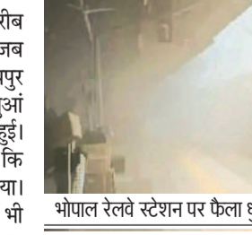
भोपाल रेलवे स्टेशन पर फैला धुआं।