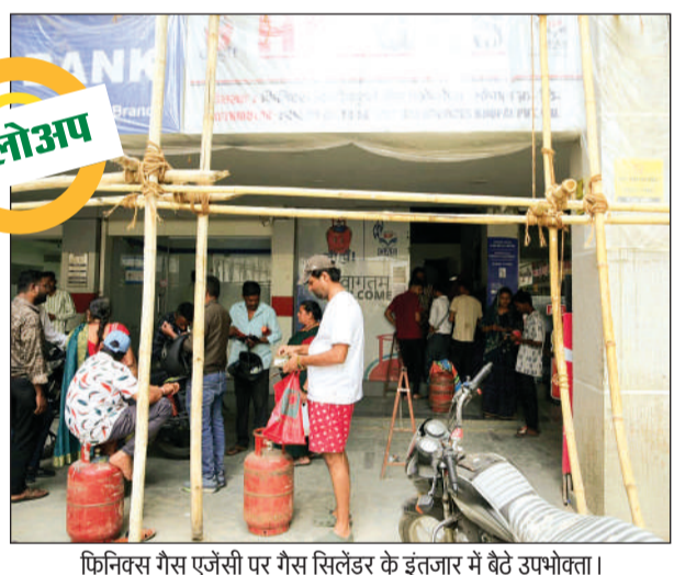
फिनिक्स गैस एजेंसी पर गैस सिलेंडर के इंतजार में बैठे उपभोक्ता।