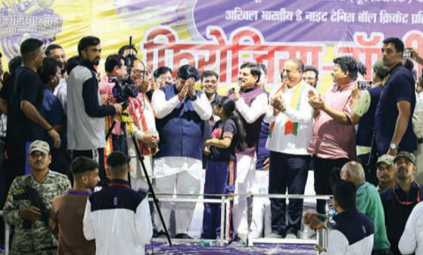
फिरोजिया ट्रॉफी मैच के दौरान मुख्यमंत्री डॉ. मोहन यादव।

फिरोजिया ट्रॉफी का आयोजन 12 अप्रैल से 19 अप्रैल तक उज्जैन के क्षीर सागर मैदान पर किया गया। फाइनल मुकाबले में दोनों टीमों के बीच रोमांचक संघर्ष देखने को मिला, जिससे दर्शक अंत तक मैच का आनंद लेते रहे। सांसद अनिल फिरोजिया ने मुख्यमंत्री डॉ. यादव का फिरोजिया ट्रॉफी में प्रत्येक वर्ष पधारने और खिलाड़ियों का उत्साहवर्धन करने पर आभार व्यक्त किया। फिरोजिया ट्रॉफी सांसद फिरोजिया के पिता स्व. भूपेन्द्र फिरोजिया की स्मृति में विगत 21 वर्षों से हर वर्ष आयोजित की जा रही है।