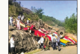
पीएम मोदी ने जताया दुःख, गुआवजे का ऐलान

यहां सोमवार सुबह एक बस हादसे का शिकार हो गई। रामनगर से आ रही बस कगोत के पास सड़क से करीब 100 मीटर नीचे गिरकर पलट गई। इस हादसे में 21 लोगों की मौत हो गई, जबकि 29 से ज्यादा यात्री घायल हो गए। हादसा सुबह करीब 10 बजे हुआ। बस में 50 यात्री सवार थे, जिनमें से ज्यादातर लोग रामनगर से उधमपुर में अपने रोजाना के काम पर जा रहे थे। 15 यात्रियों की मौके पर ही मौत हो गई थी, जबकि बाकी 6 लोगों ने इलाज के दौरान दम तोड़ दिया। घायलों के मुताबिक बस ओवरलोड थी, रफ्तार भी तेज थी। कगोत नाले के पास अचानक बस का टायर फट ▶ शोष पेज 6 पर