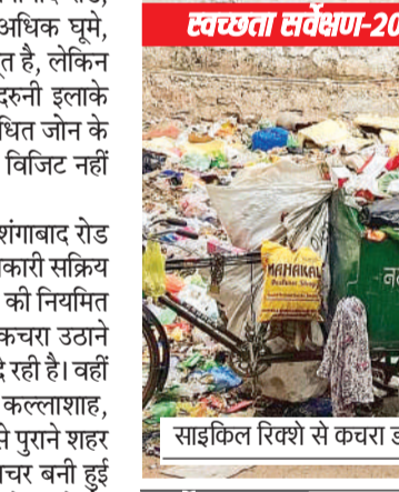
साइकिल रिश्वे से कचरा ढंटा किया जा रहा।

बरखेड़ी, अहाता कल्लाशाह, जहांगीराबाद, काजीकैप, करोंद के अंदरूनी इलाकों में सफाई में लापरवाही