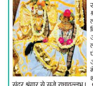
सुंदर श्रृंगार से सजे राधावल्लभ।

खस के बंगले में विराजमान हुए श्री राधावल्लभ, धारण की चांदनी पोशाक