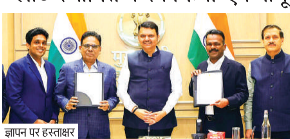
ज्ञापन पर हस्ताक्षर

महाराष्ट्र के मुख्यमंत्री देवेंद्र फडणवीस की गरिमामयी उपस्थिति में हस्ताक्षर किए गए, जो राज्य सरकार की उच्च मूल्य वाले औद्योगिक निवेश आकर्षित करने की प्रतिबद्धता को पुनः स्थापित करता है। यह रणनीतिक निवेश महाराष्ट्र को औद्योगिक विकास के लिए एक पसंदीदा गंतव्य के रूप में स्थापित करता है और भारत के विनिर्माण क्षेत्र की वृद्धि में योगदान देते हुए श्याम स्टील की विस्तार की प्रतिबद्धता को दर्शाता है। चंद्रपुर में प्रस्तावित यह संयंत्र स्टील विनिर्माण परिस्थितिकी तंत्र को मजबूत करेगा।