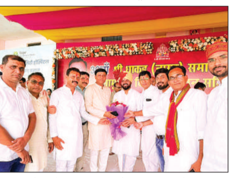
सम्मेलन में आए हुए अतिथियों का स्वागत करते हुए।

सम्मेलन से सामाजिक एकता और भाईचारे को भी मिलती है मजबूती