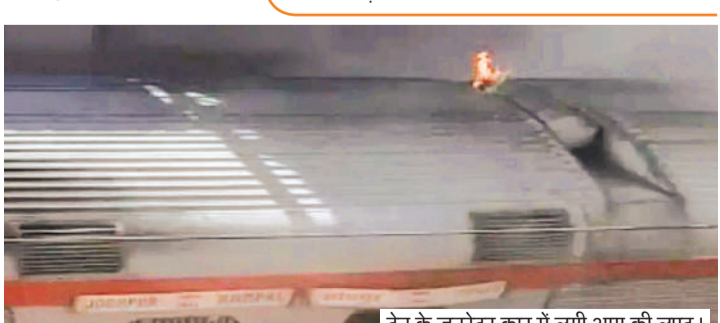
ट्रेन के जनरेटर कार में लगी आग की लपट।

ट्रेन में धुआं उठने का समय साढ़े तीन बजे था, जबकि गाड़ी 4.40 भोपाल स्टेशन से निकलती है। इसलिए उस समय तक गाड़ी में यात्री सवार नहीं थे, रेलवे अधिकारियों के मुताबिक किसी प्रकार की जन धन की हानि नहीं हुई है। रेलवे अधिकारियों ने बताया कि जैसे ही स्टेशन पर धुआं देखा गया तुरंत फायर टीम ने जनरेटर कार पर जाकर फायर बूस्टर की मदद से आग पर काबू पाया गया।