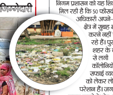
निगम का तर्क- जिम्मेदारों पर सख्त कार्रवाई होगी

निगम आयुक्त संस्कृति जोन का कहना है कि पूरे शहर में सफाई नियमित चल रही है। अगर कहीं लापरवाही मिली तो जिम्मेदारों पर सख्त कार्रवाई करेगा। जो नोडल अधिकारी फील्ड में नहीं जा रहे हैं उन पर भी कार्रवाई होगी। ऐसे अधिकारियों को सूची बनाई जा रही है।