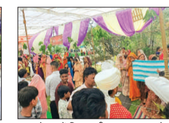
सम्मेलन में विवाह की रस्म अदा करते हुए।

की शादी हुई। वहीं पूरे नगर में भगवान परशुराम की जयंती का भी कार्यक्रम