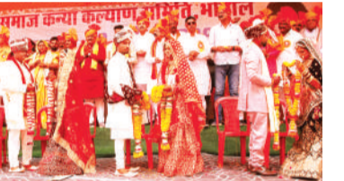
श्री 360 गौत्रिय खटीक समाज सक्ल मंच भोपाल द्वारा आयोजित 32वें सामूहिक आदर्श विवाह सम्मेलन कार्यक्रम का आयोजन किया गया। इसमें करीब 14 से अधिक जोड़े दाम्पत्य पत्र में बंधे। भगवान परशुराम जयंती पर परशुराम मंदिर परिसर में प्रोग्रेसिव ब्राह्मण फेडरेशन ऑफ इंडिया द्वारा संगठन का आधिकारिक पोस्टर लॉन्च किया गया। इस अवसर पर बड़ी संख्या में समाज के गणमान्य नागरिक, युवा कार्यकर्ता एवं पदाधिकारी उपस्थित रहे।

परशुराम जयंती पर प्रोग्रेसिव ब्राह्मण फेडरेशन ऑफ इंडिया का पोस्टर लॉच